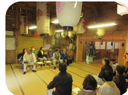
商工祈願をしていただいた