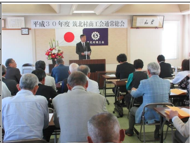
前山商工会長の挨拶