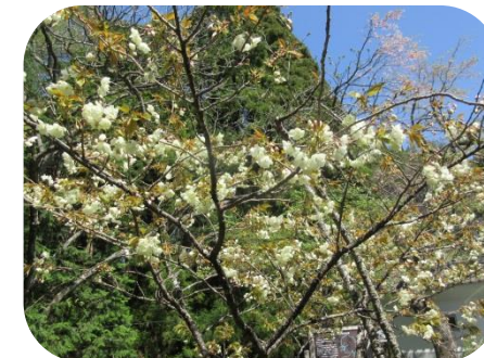
きれいに咲いているウコン桜