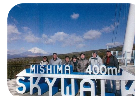
三島スカイウォーク