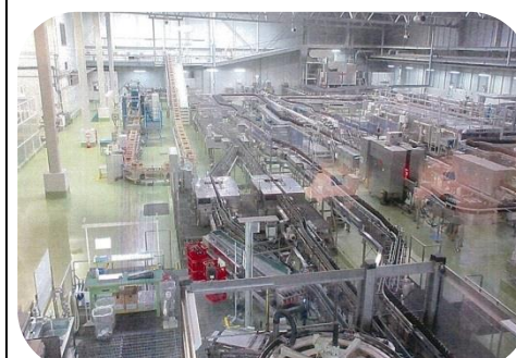
アサヒビール神奈川工場見学