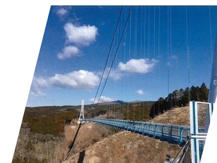
全長 400m の日本一長い吊橋