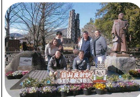
2015 世界文化遺産登録 葦山反射炉