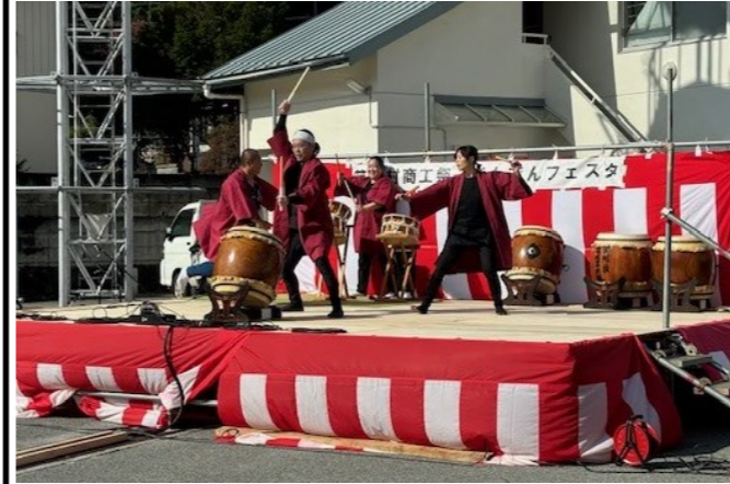
四阿こだま太鼓の演奏